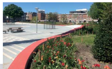
Grevelingenveld, Den Haag

Moderne BMX- en skateparken moeten een hoog flow element hebben. Een strakke slijtvaste betonnen ondergrond is hierbij van groot belang. Door het aanbrengen van slijtvaste (gekleurde) coating wordt de baan niet alleen esthetisch mooier, maar ook vele malen duurzamer.