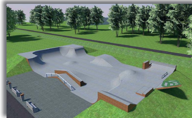
ontwerp van BMX- en Skatepark, Apeldoorn