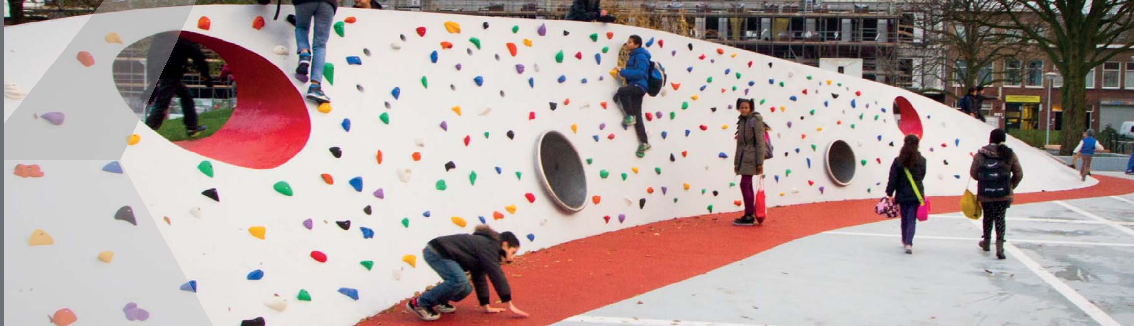
Grevelingenveld, Den Haag

gecombineerde klimwand/ skatevoorziening in speciale vormen met spuitbeton